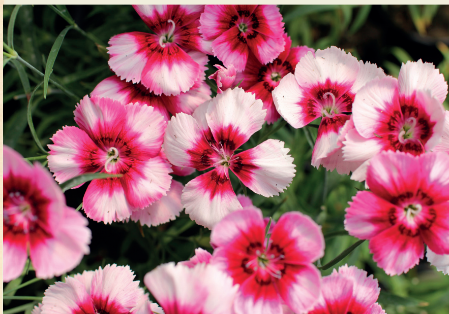
Dianthus chinensis ,Venti Parfait Crimson Eye'

Hvozdíky se pěstují v zahradách již po staletí. Antičtí Řekové a Římané je zaplétali do slavnostních věnců. Středověké klášterní zahrady je pěstovaly pro léčebné účely i pro ozdobu. V renesanci se hvozdíky staly symbolem lásky, jsou oblíbeným motivem obrazů. Dnes jsou z rodu Dianthus vyšlechtěny desítky tisíc kultivarů.