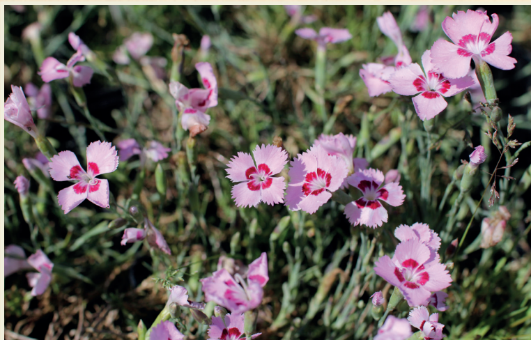
Dianthus plumarius ,Dixie Red Rose Bicolor'

Hvozdíky jsou nenáročné na živiny a přihnojování by mělo být střídité. Přehnojení, zejména dusíkem, způsobuje bujný vegetativní vzrůst na úkor kvetení a zhoršuje mrazuvzdornost.