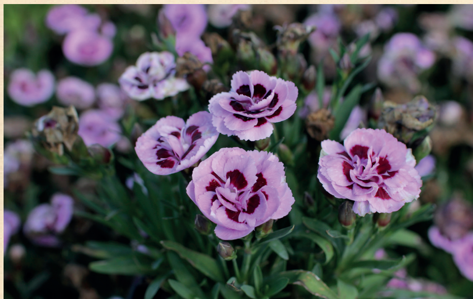
Dianthus caryophyllus ,Sw.P. Pink Burgundy Eye'

Nejznámější druh celého rodu. Jeho původ není zcela jasný, pravděpodobně pochází ze středomořské oblasti, odkud se šířil jako kulturní rostlina již od antiky. Tvoří zpevněné lodyhy s pevnými, modrozeleně ožiněnými listy a velkými, plnými nebo poloplnými květy v neobyčejné barevné šíři. Intenzivně voní. Kvete průběžně od jara do podzimu. Výška 40–70 cm. Pěstuje se zejména jako řezaná květina, v teplejších polohách i jako trvalka.