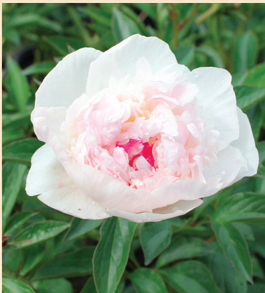
P. lactiflora ,Madam de Verne-