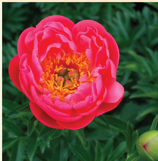
P. lactiflora ,Coral Sunset'