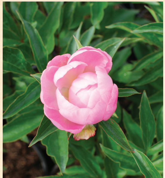
P. lactiflora, 'Catharina Fontijn'