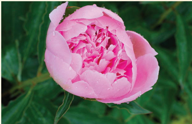
P. hybrid, 'Alertie'

Pivoňka je po požití jedovatá pro kočky, psy a koně.