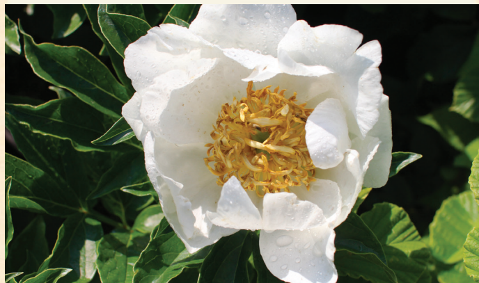
P. lactiflora ,Jan van Leeuwen'