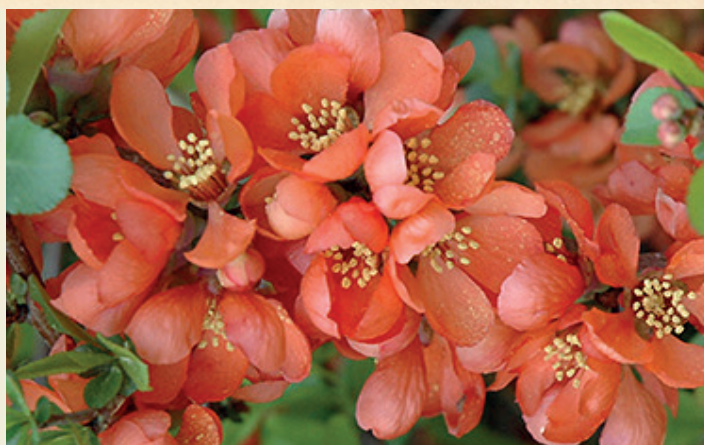
Chaenomeles superba ,Salmon Horizon'