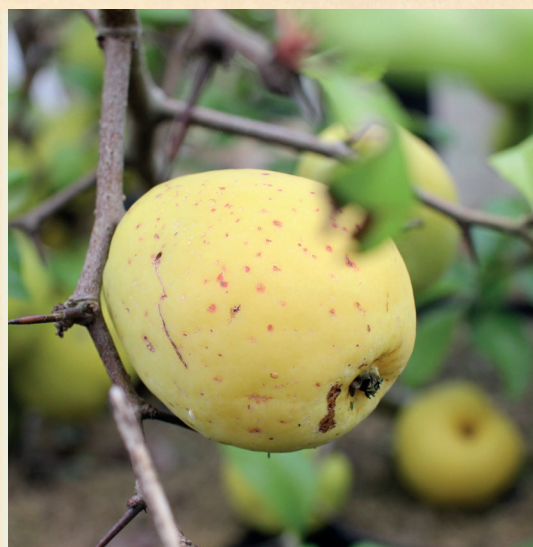
Chaenomeles superba ,Crimson and Gold'