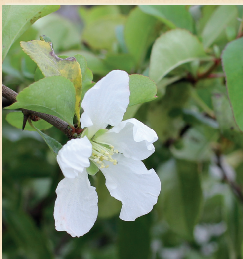
Chaenomeles speciosa 'Jet Trail'