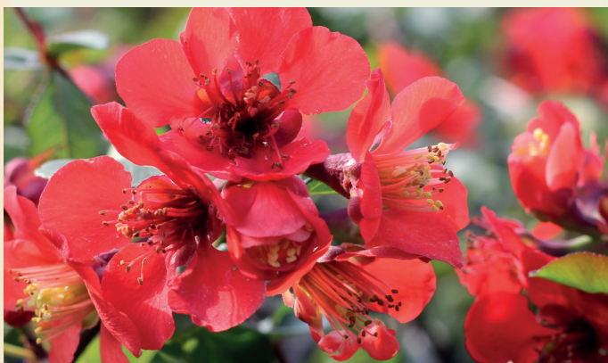
Chaenomeles superba ,Etna'